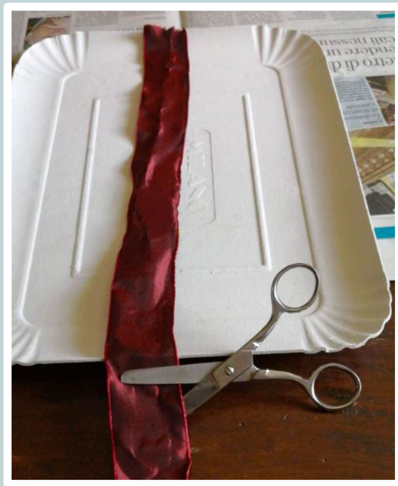
Tagliamo il nastro della lunghezza del cabaret